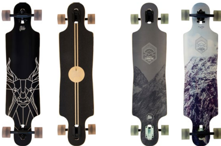
Deer Black UT-3809-20D