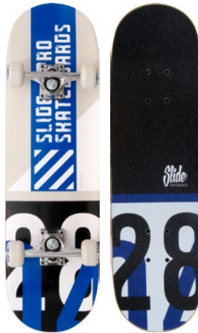
Blue Street UT2822-3