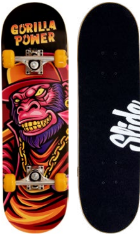
Gorilla Power UT2822-1