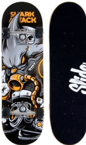
Shark Attack UT2820-4