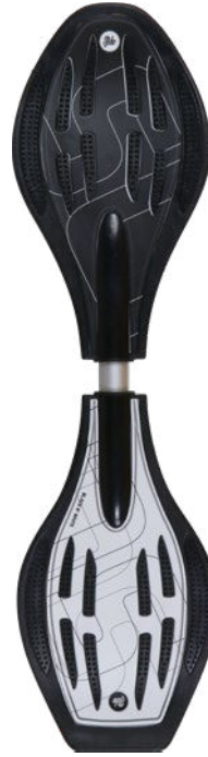
Black & White RT-FY-A04