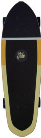
Stripes Yellow UT2822-5