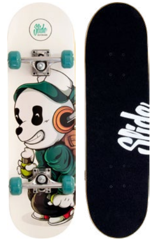
Graffiti Pete UT2822-4