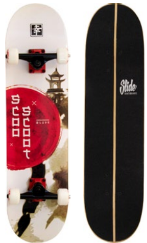
Scoo Scoot UT3122-2