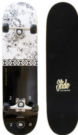
Black & White UT3120-1