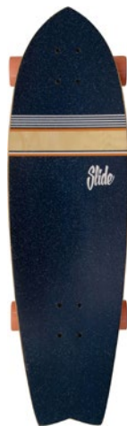
Stripes orange UT3422-1