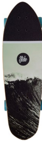
Surfing Miami UT2822-6