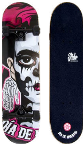
Los Muertos UT3120-7