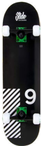
Nr. 9 UT3108-202